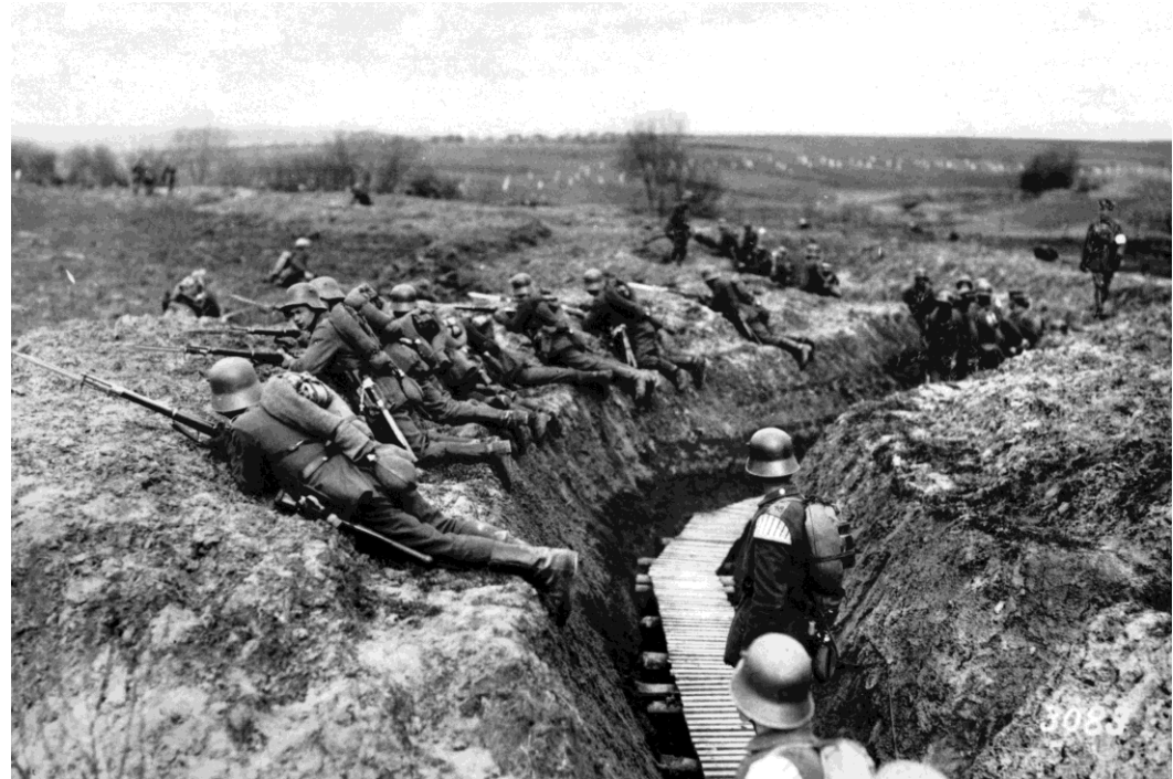
Soldados alemães em trincheira durante a Primeira Guerra Mundial.