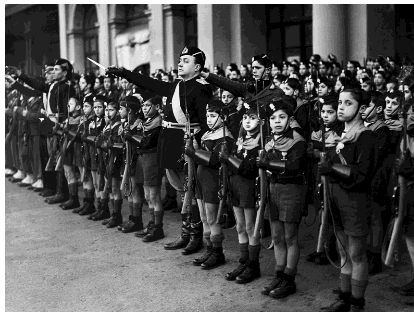
Os membros da Balilla , movimento da juventude fascista da Itália, cumprimentam Benito Mussolini após seu retorno da Grã-Bretanha, janeiro de 1939.