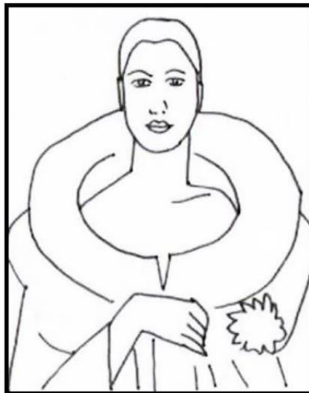
Auto Retrato De Tarsila Do Amaral Pinte!!

No final da década de 1920, Tarsila criou os movimentos Pau-Brasil e Antropofágico. Entre as propostas desta fase, Tarsila defendia que os artistas brasileiros deveriam conhecer bem a arte europeia, porém deveriam criar uma estética brasileira, apenas inspirada nos movimentos europeus. No ano de 1926, Tarsila casou-se com Oswald de Andrade, separando-se em 1930. Entre os anos de 1936 e 1952, Tarsila trabalhou como colunista nos Diários Associados (grupo de mídia que envolvia jornais, rádios, revistas). Tarsila do Amaral faleceu na cidade de São Paulo em 17 de janeiro de 1973. A grandiosidade e importância de seu conjunto artístico a tornou uma das grandes figuras artísticas brasileiras de todos os tempos.